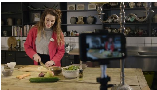
Nimm dich selbst mit dem Memory Mic auf...

Das Memory Mic lässt sich via Bluetooth mit der MEMORY MIC Smartphone App (kostenlos bei Google Play oder im Apple Store erhältlich) verbinden. Es funktioniert drahtlos aus jeder Entfernung über das Smartphone und erlaubt so viel Freiraum bei der Erstellung der Videos. Anschließend einfach per Knopfdruck Sound und Video über die App synchronisieren. Die App verfügt außerdem über eine Mischfunktion, über die sich intuitiv die richtige Mischung aus dem Sound des Memory Mic und den vom Smartphone aufgenommenen Umgebungsgeräuschen einstellen lässt.